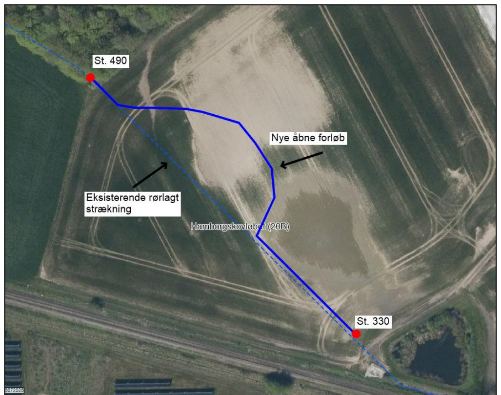
Billede 3 Kort der viser projektet med den eksisterende rørlagte strækning og den ansøgte åbne strækning.

Åbningen af det rørlagte vandløb vil skabe nye levesteder og spredningsmuligheder for de padder og insekter der lever i de nærliggende søer og i den nuværende skov.