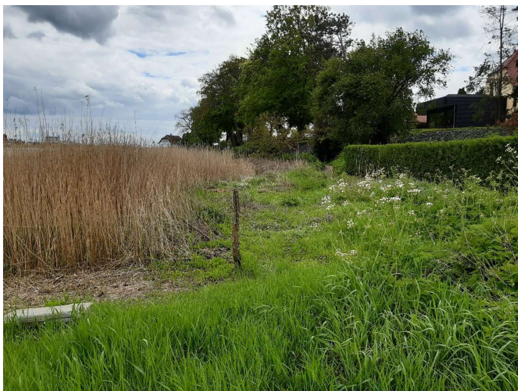
Billede 2: Højre side af bro placerings stedet