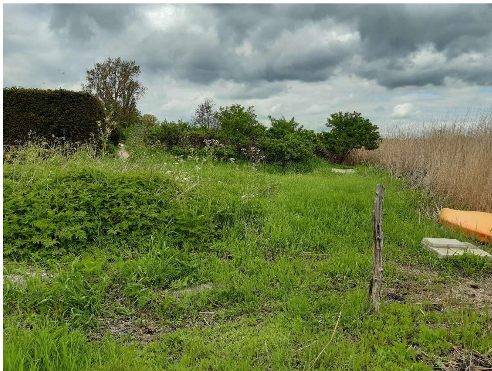
Billede 1: venstre side af bro placerings stedet.