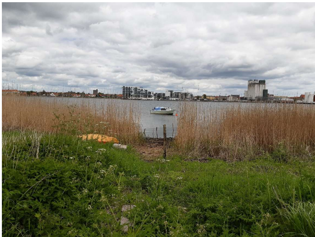
Billede 3: bro placerings sted lige frem i billedet