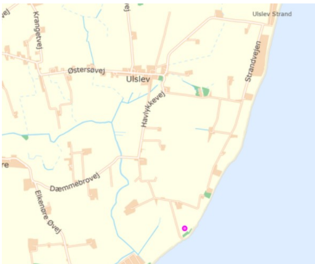
Den lilla markering viser den ansøgte placering