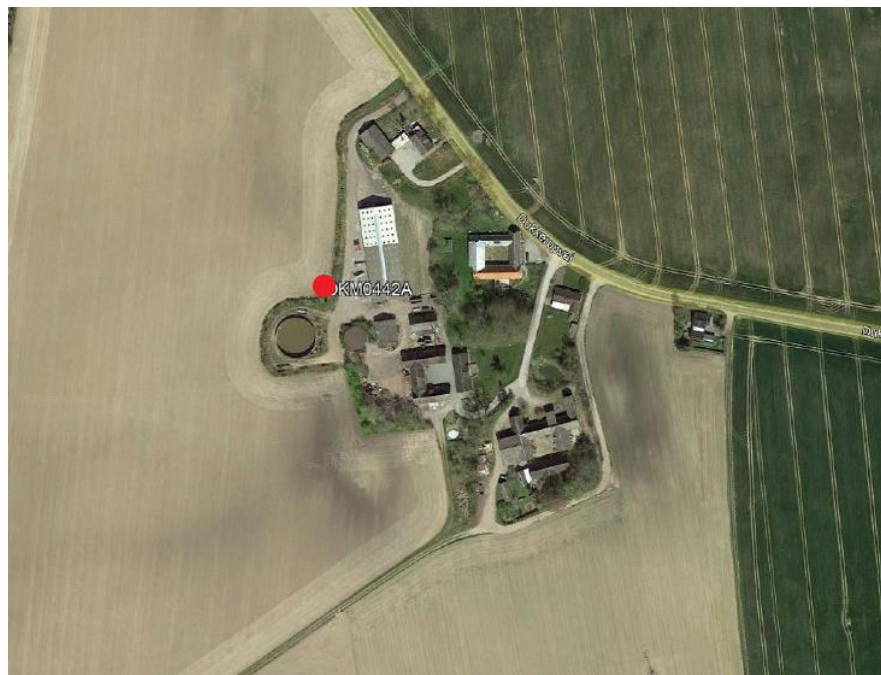
Placeringen af masten er markeret med rødt

TELEFONTIDER: MAN-ONS KL. 9:00-11:00 TORS KL. 15:00-17:00 FRE KL. 9:00-11:00