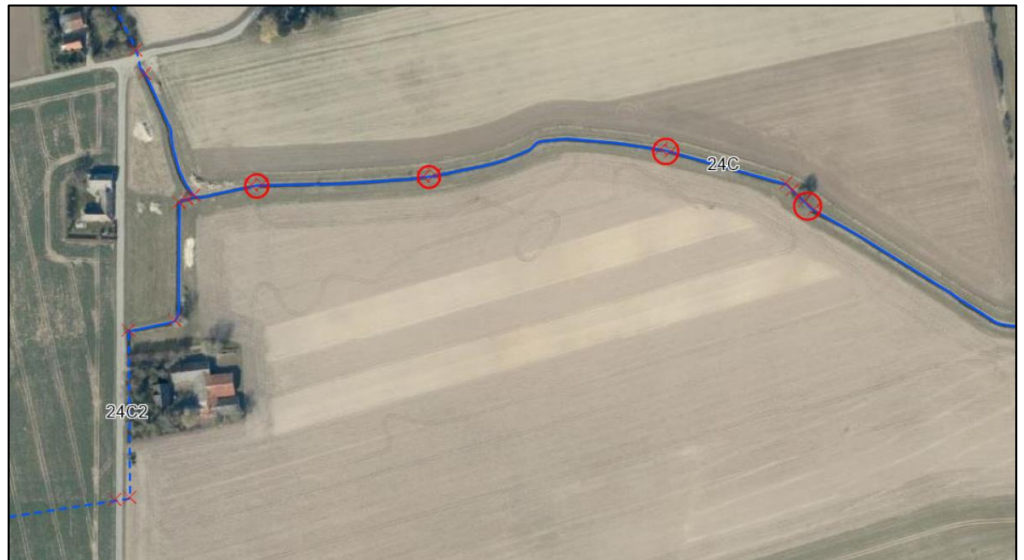
Billede 2: Oversigtskort over hvilke overkørsler der ønskes fjernet. Markeret med rød cirkel