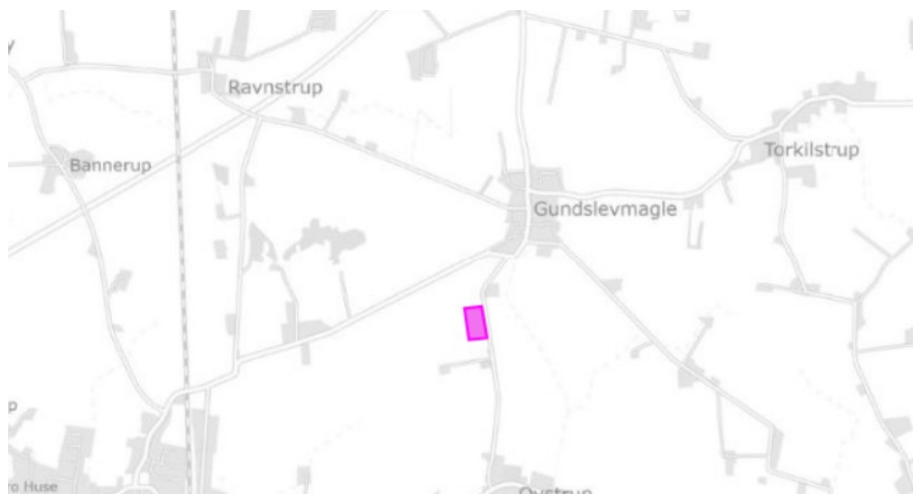
Ejendommen er markeret med lilla