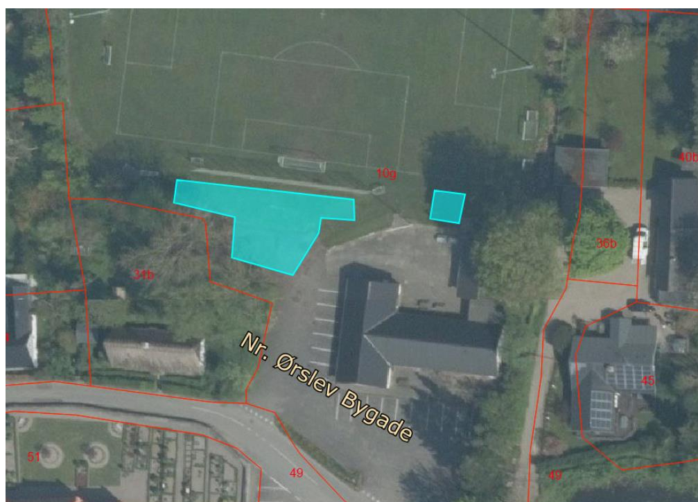
Legeplads etableres inden for det turkise område