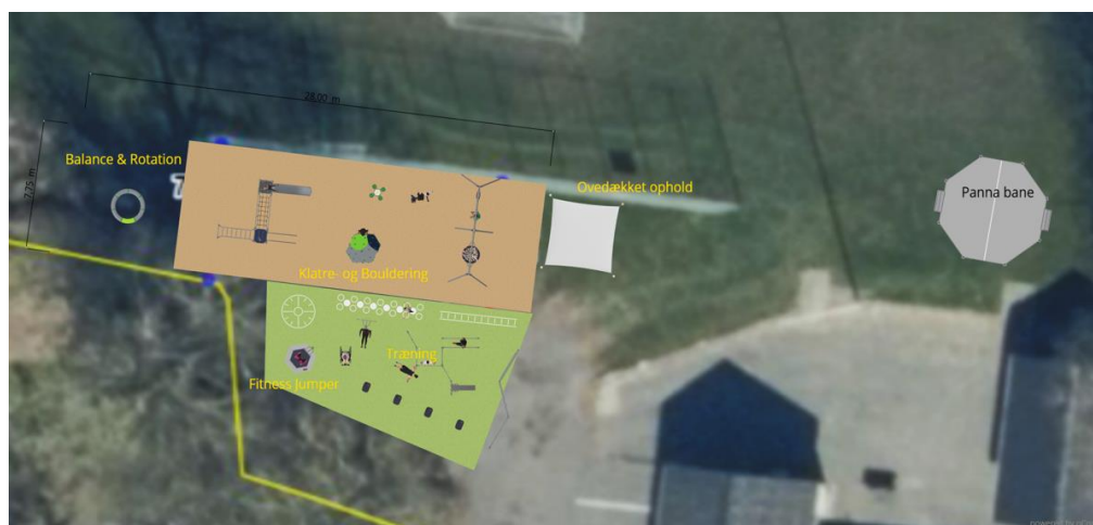
Området i detaljer