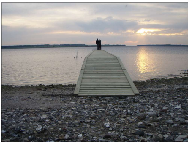
Figur 2.3 Fotos af lignende badebroer. Venstre foto: eksempel på badebro, der har en bredde på 1,6 m. Højre foto: eksempel på platform med målene 3,5 x 5 m.