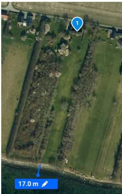
Figur 1.2. Luftfoto med beliggenheden af broen samt broens længde, angivet med blå linje.