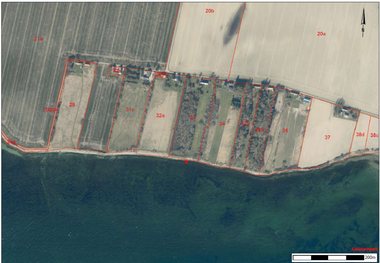
Figur 1.1. Luftfoto med matrikelgrænser samt placering af broen, markeret med rød prik.