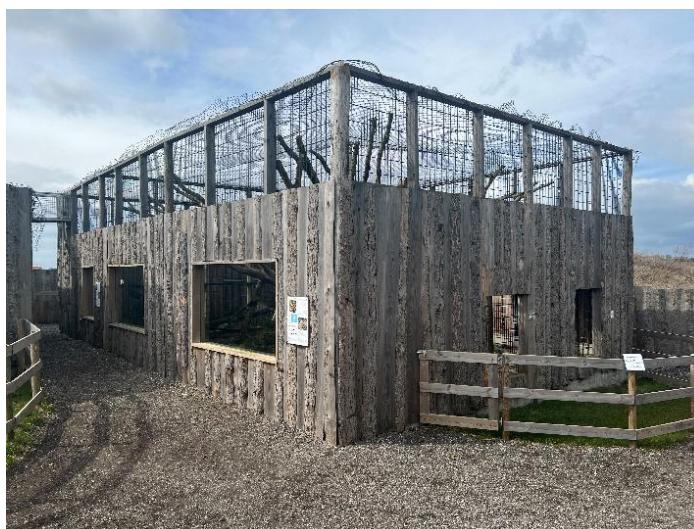
Billedet af pumanlægget