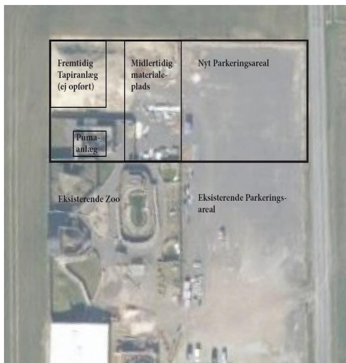
Situationsplan over udvidelsen