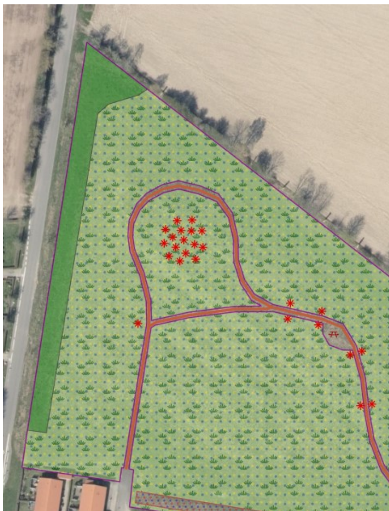
Vandhullet er vist med blå markering