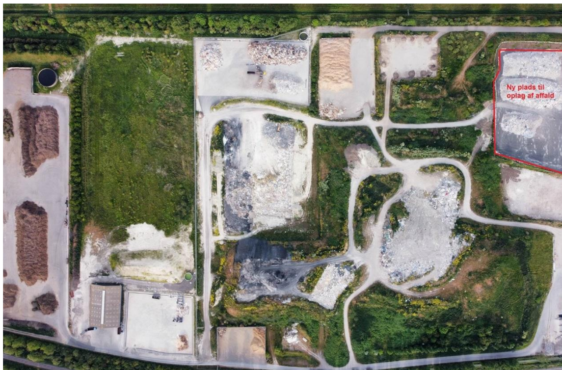
Figur 3 Rødt markerede område hvor der pumpes vand under belægning