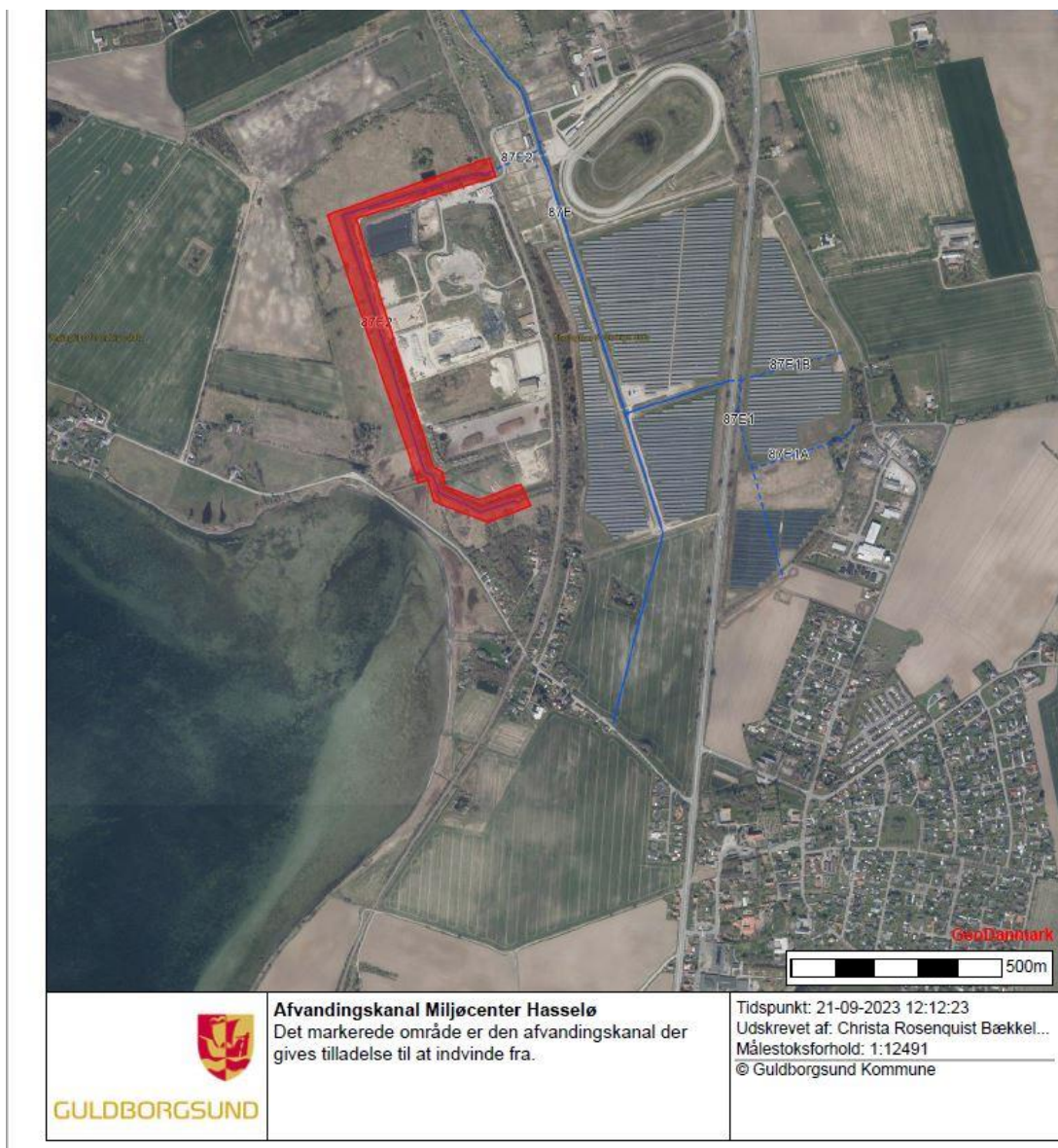
Figur 2 Vandløb