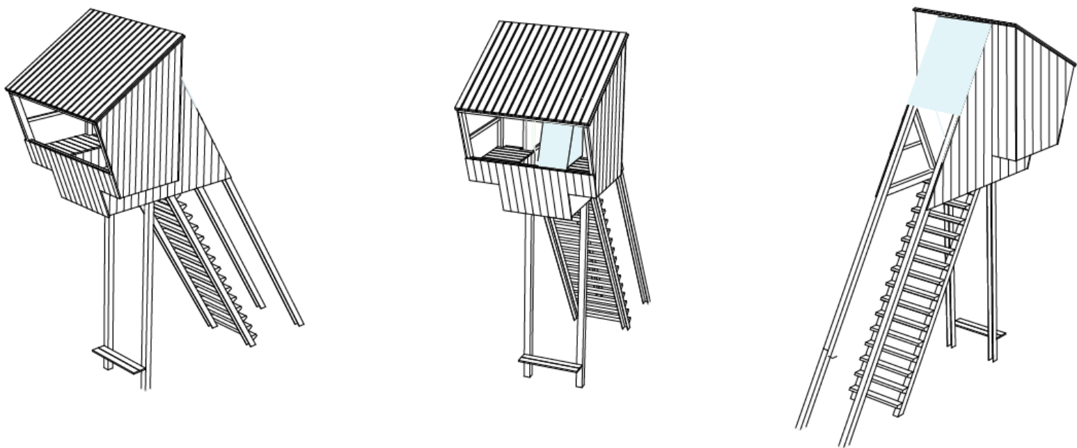
Tegning af hvordan fuglekiggertårnet vil se ud