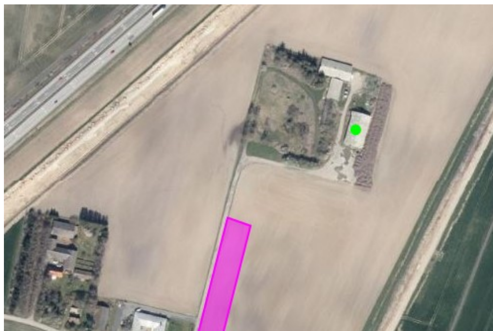
Det ansøgte areal er markeret med lilla