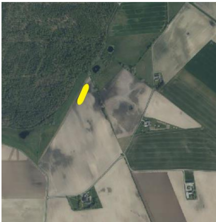
Placeringen af det ansøgte er markeret med gult.