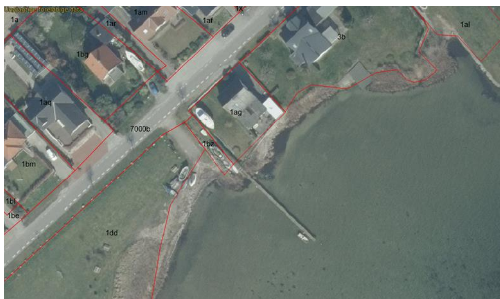
Luftfoto fra 2020. Beliggenheden af bade/bådebroen.