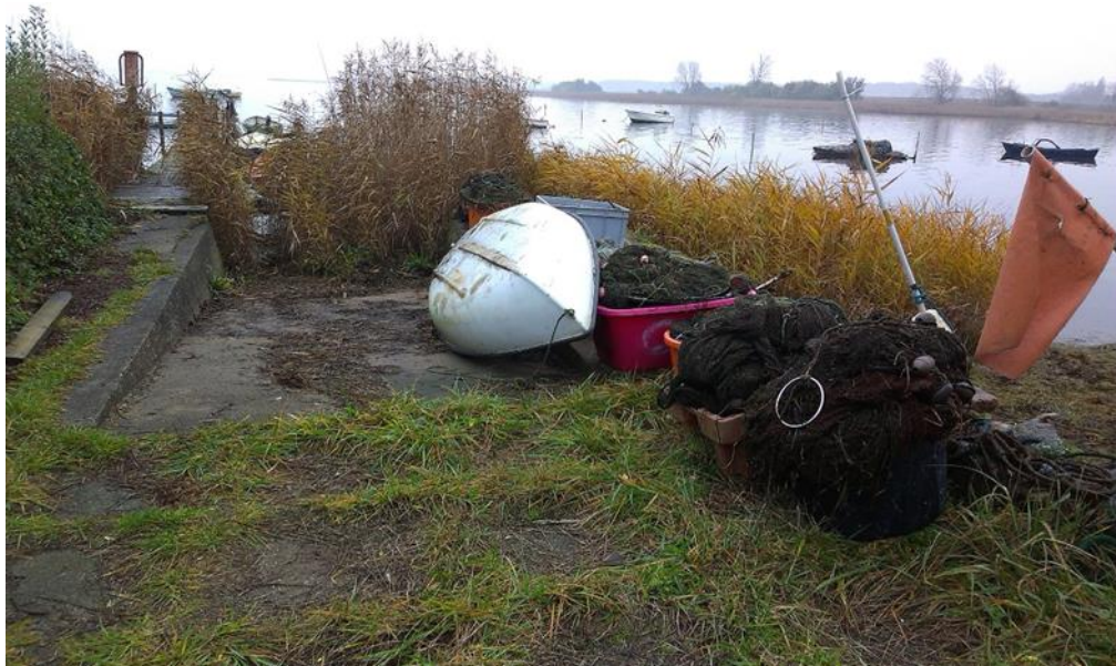
Bade/bådebroens landfæste samt båd og fiskenet set mod sydøst – foto taget af Center for Teknik & Miljø 21. november 2019