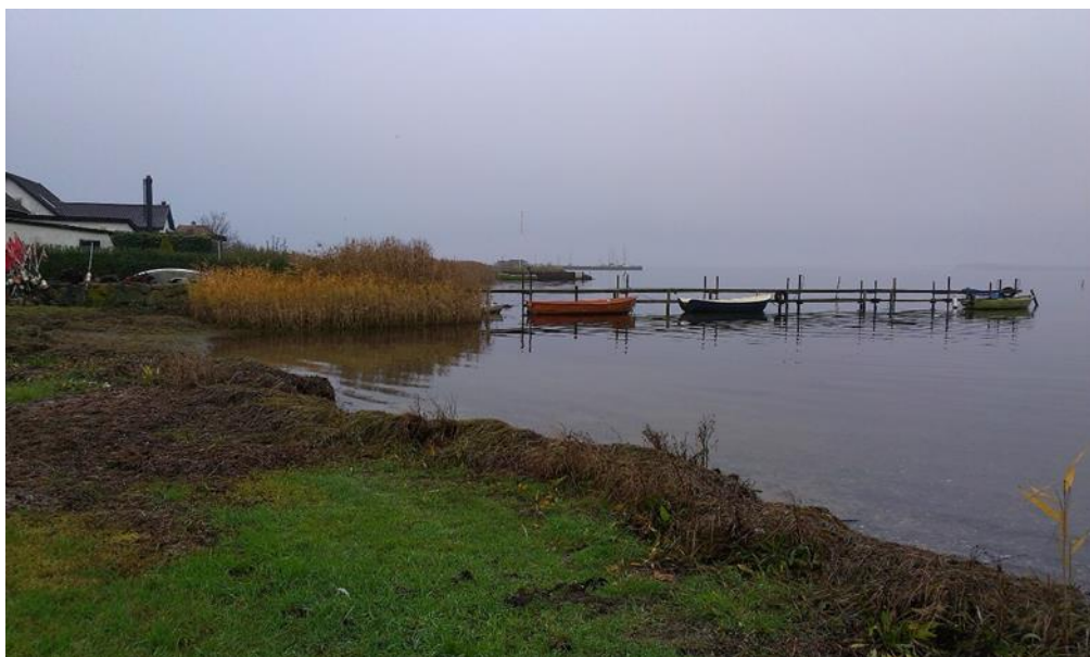
Bade/bådebroen set mod nordøst – foto taget af Center for Teknik & Miljø 21. november 2019