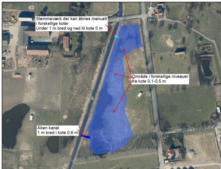
Billede 2 Kort over forslag til projektiltag.

Der ansøges om at grave to kanaler fra vandløbet og ind til græsarealet. Begge kanaler bliver mellem 1-2 m bredde, se billede 2. Alle koter nævnt er i DVR90. Den sydlige kanal skal graves i kote 0,6 m og den nordlige i kote 0 m. Der etableres et lille stemmeværk af træ i den nordlige kanal, der har en overløbskant i kote 0,6 m.