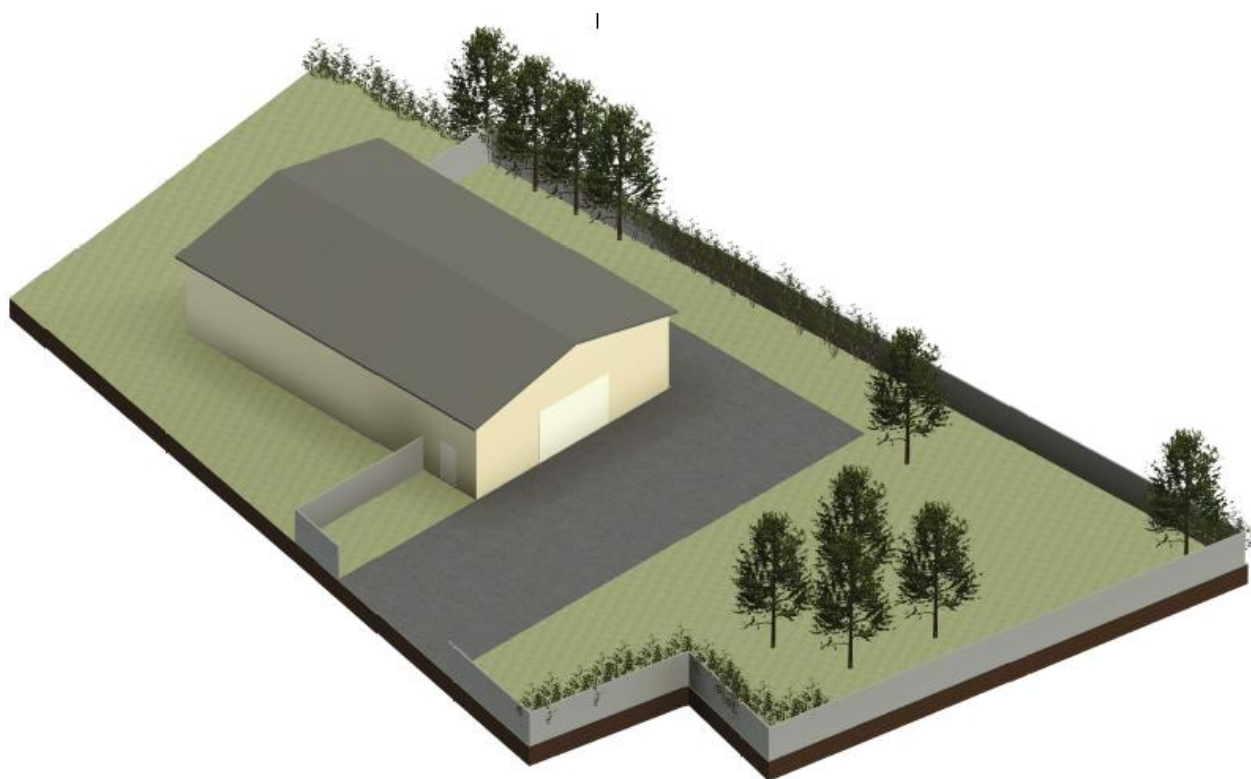
Visualisering af hvordan bygningen kommer til at se ud