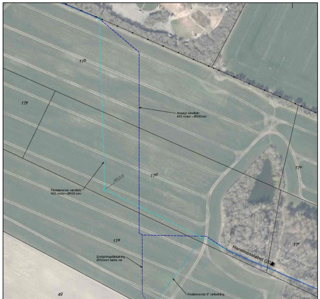
Billede 2 Kort fra ansøgningsmaterialet. Lyseblå linje er det eksisterende trace og den mørkeblå er den ønskede omlægning.

Der ansøges om at omlægge vandløbet længere øst på og mere på linje med den åbne strækning, længere nedstrøms. Den nye vandløbsstrækning bliver forlænget med omkring 25 m. For at afhjælpe forsinkelse bliver rørdimensionen forøget fra Ø400 mm til Ø500 mm PVC. Den nye strækning vil forblive i de samme koter. Der bliver i samme omlægning, omlagt et hoveddræn, der har et opland på omkring 30 hektar. Hoveddrænet er i dag tilsluttet i station 624, efter omlægningen bliver det tilsluttet i station 570 (ny stationering). Hoveddrænet omlægges og dimensionen udskiftes fra 9 tommer rør til Ø250 mm tætte rør i PVC. Projektet vil ikke forværre vandløbets eller hoveddrænets afstrømningsevne. Ansøgningsmaterialet vedlægges høringsbrevet som bilag.