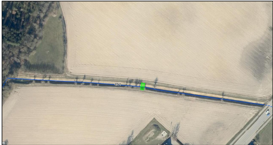
Figur 2. Oversigtskort der viser det offentlige vandløb, kvl 4N1 (mørkeblå) og den ønskede placering af broen (grønne markering).

I 2022 blev brinken på den nordlige side af vandløbet gravet ned i kote ca. 5,5 (DVR90). Broen vil derfor blive etableret i gældende terrænkote og have et lige forløb over til den sydlige brink. Her vil brinken blive forskudt lidt længere syd på og blive etableret med nogle granit kantsten, der er 1 m bredde, som trin ned til broen. Der vil derfor stadig være arbejdsbælte på den sydlige side af vandløbet og der sker minimal ændring af brinken, se bilag 2.