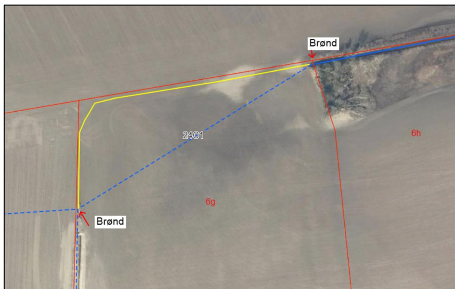
Billede 2: Den blå stiplede linje er den eksisterende rørlægning (24C1), der ønskes omlagt i det gule trace, længere nord på matriklen.

En strækning på ca. 170 meter af det rørlagte vandløb forlægges mod nord. Forlægningen vil ske i PE anlægsrør, med en rørdimension på Ø300, hvilket er samme dimension som eksisterende rør.