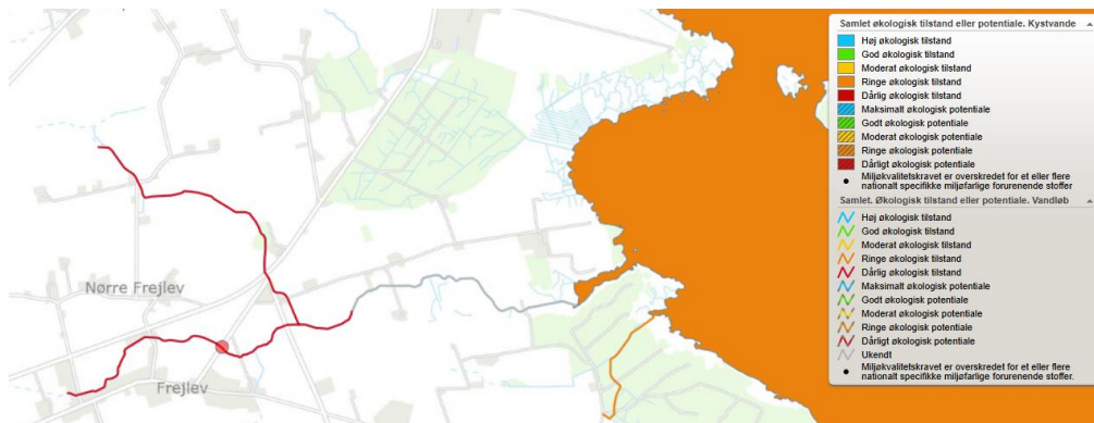
Figur 1 Vandområdenes tilstand som angivet i Vandområdeplan 2021-2027. Udløbet til Frejlev Å er angivet med rød prik

På Figur 1 nedenfor er vist et kortudsnit fra Vandområdeplan 2021-2027.