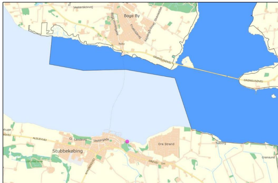
De marine habitatnaturtyper i Natura 2000-område 168 i Grønsund mellem Falster, Bogø og Møn. Natura 2000-området er afgrænset af sort streg. Habitatnaturtype 1160 Bugter og vige = lyseblå signatur. Belliggheden af udledningspunktet fra Stubbekøbing Renseanlæg er vist med pink prik.