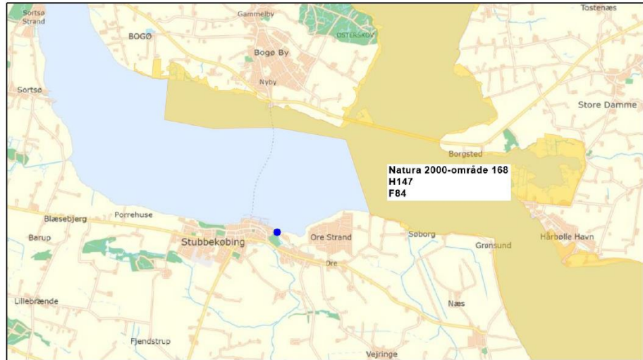
Overigtskort. Omtrentlig placering af udledningspunkt er angivet med blå prik. Natura 2000-området er angivet med gul signatur.