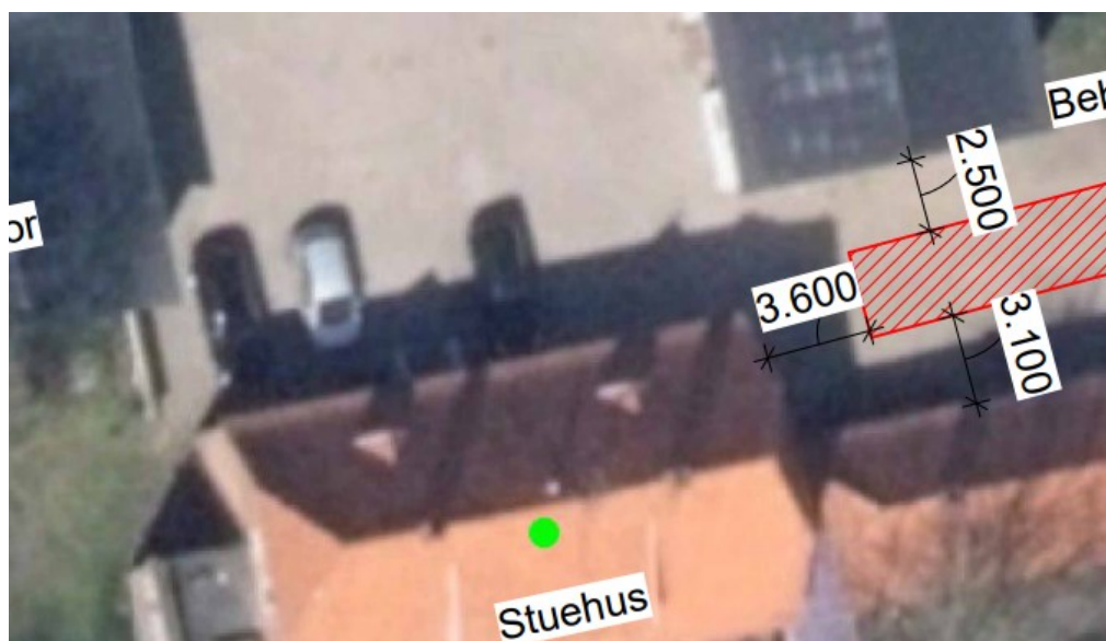
Det skraverede areal viser den ansøgte placering