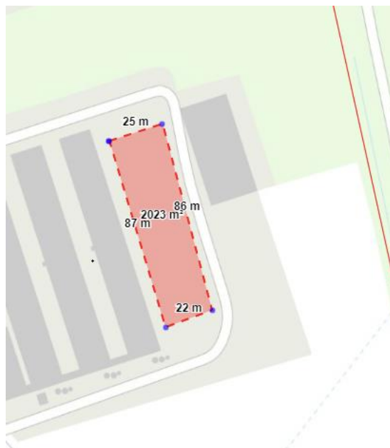
Billedet viser størrelsen på anlægget