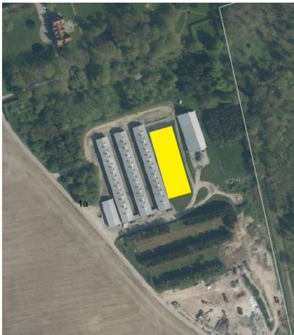
Billede viser placeringen af solcellerne