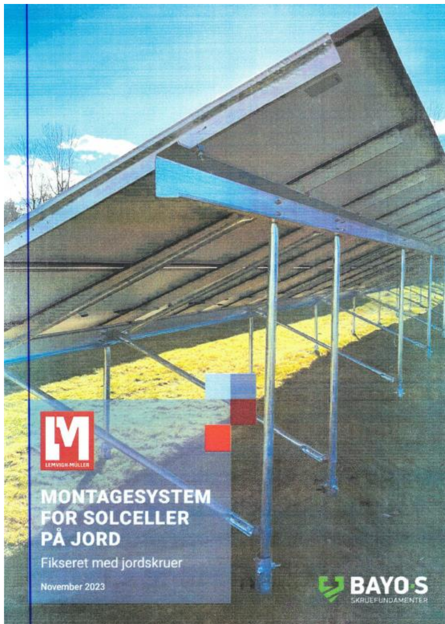
Billede af typen af solcellestativ, som der er ansøgt om.