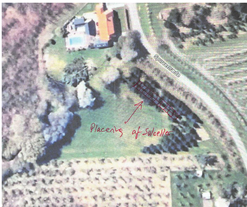
Kortene viser placeringen af solcellerne.