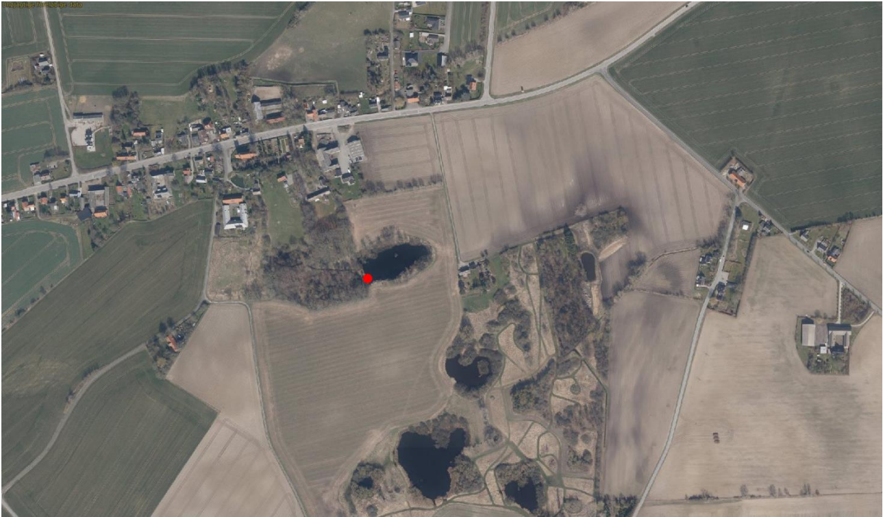
Fiskebroens placering er markeret med en rød prik.