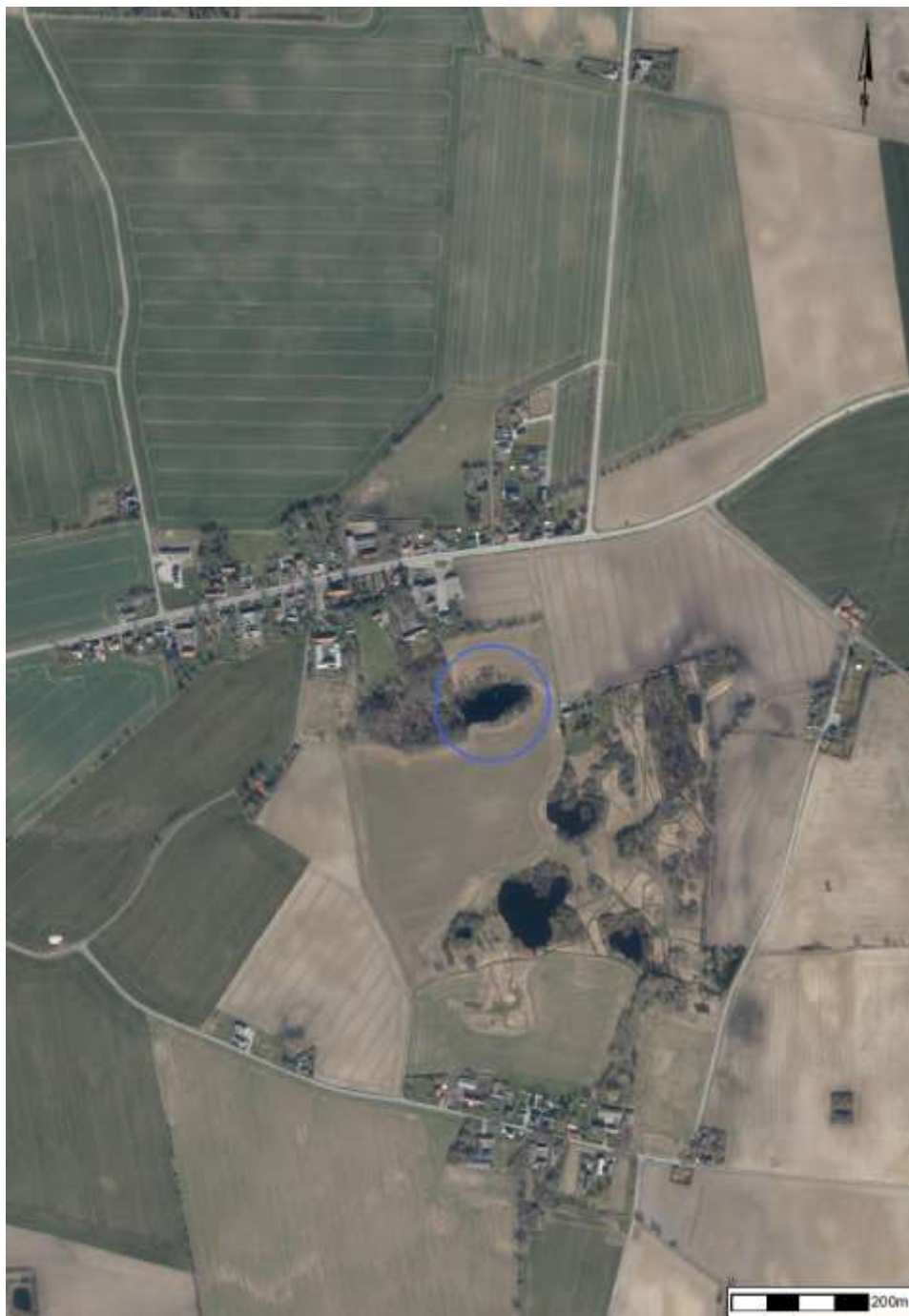
Projektområde (blå cirkel). Vejen nord for projektområdet er Grønsundsvej.