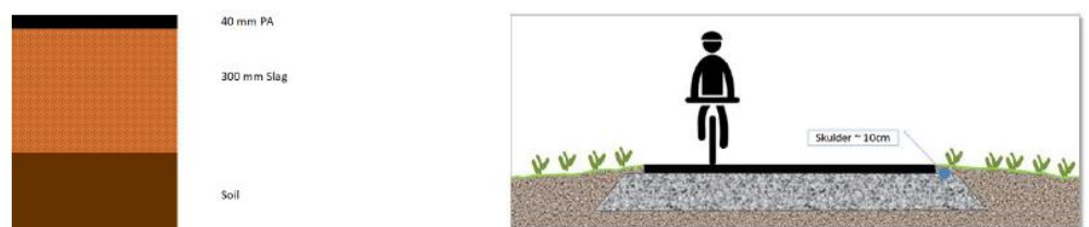
Figur 2: Figurer fra ansøgning, der viser slaggelagets opbygning. Venstre: belægningsopbygning med bærelag af slagter. Højre: Tværsnit af cykelsti med uafdækkede skuldre.

I forbindelse med byggeriet af den nye Storstrømsbro skal der på Falster anlægges nye cykelstier på begge sider af den forlagte Storstrømsvej fra rundkørslen og ned til Vedby Vesterskovvej. Cykelstierne tænkes anlagt med bærelag af henholdsvis affaldsforbrændingsslagter under cykelstien nordvest for vejen og knust asfalt under cykelstien sydøst for vejen. Stykket af cykelsti, der omhandles af denne tilladelse, anlægges som vist nedenfor på figur 2.