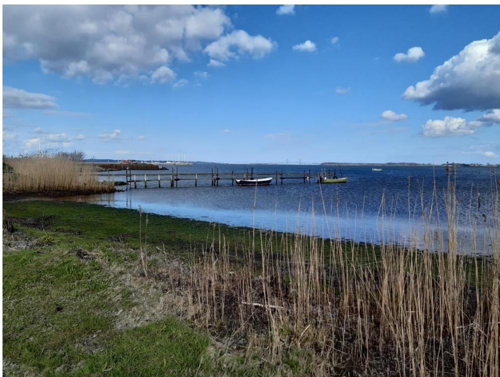
Bådebroen set mod nordøst – foto fra 27. april 2023