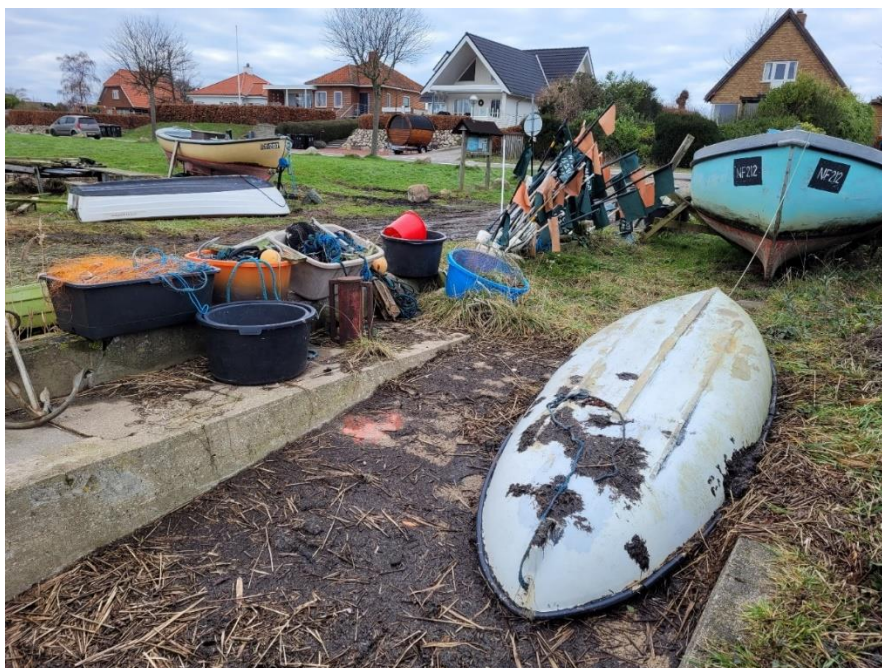
Fiskegrej mm. – taget mod vest fra bådebroen – foto fra 14. december 2023