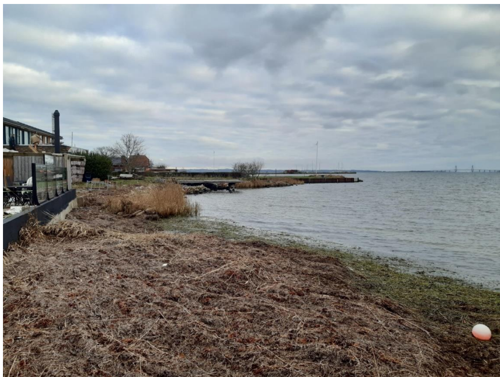
Grunde er 'trukket ud' – taget fra bådebroen mod nordøst - foto fra 14. december 2023