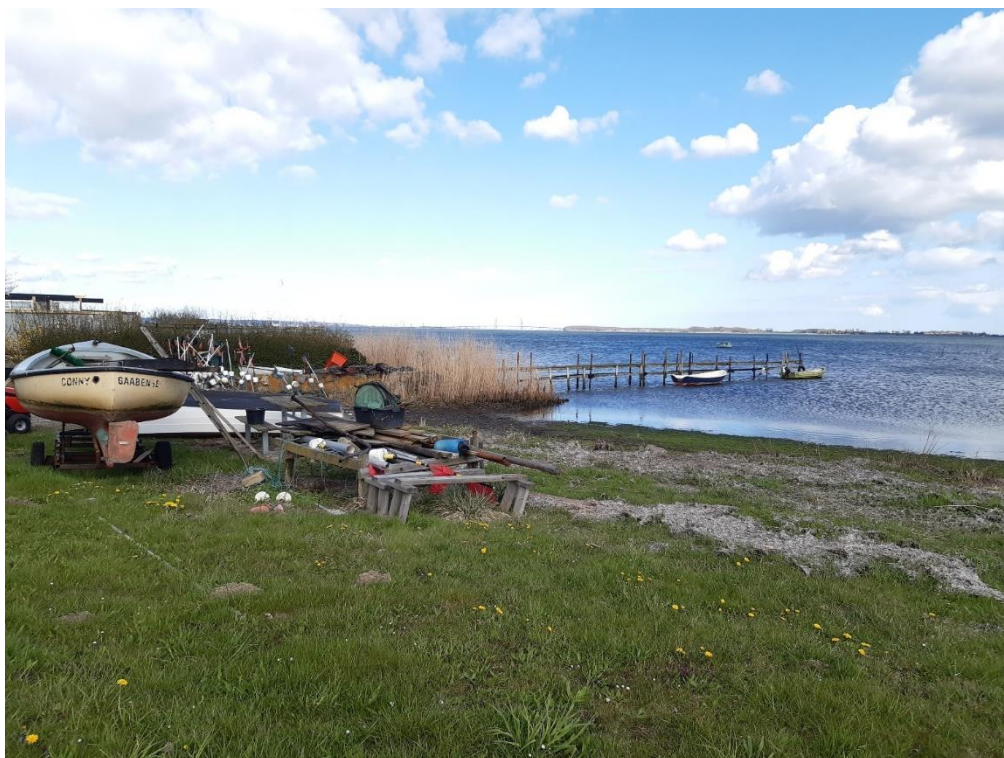
Bådebroen set mod nordøst – foto fra 27. april 2023