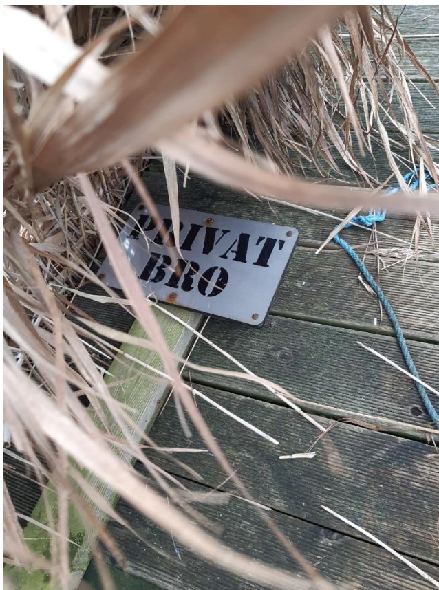
'Privat Bro' skilt på bådebroen – foto fra 14. december 2023