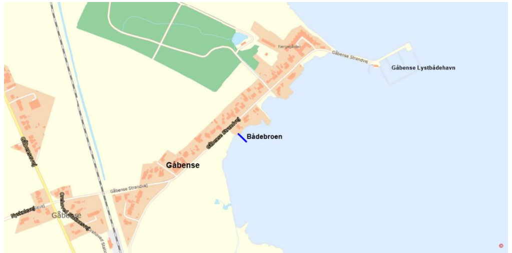
Oversigtskort – Gåbense. Bådebroen er angivet med blå streg.