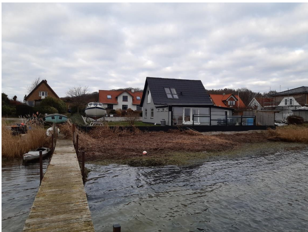
Indblik fra bådebroen til naboejendom – foto fra 14. december 2023