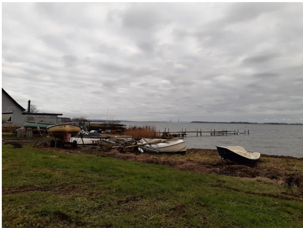
Bådebroen set mod nordøst – foto fra 14. december 2023