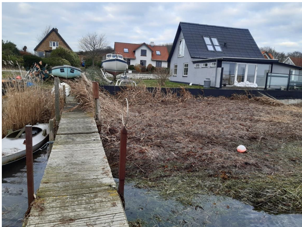
Indblik fra bådebroen til naboejendom – foto fra 14. december 2023