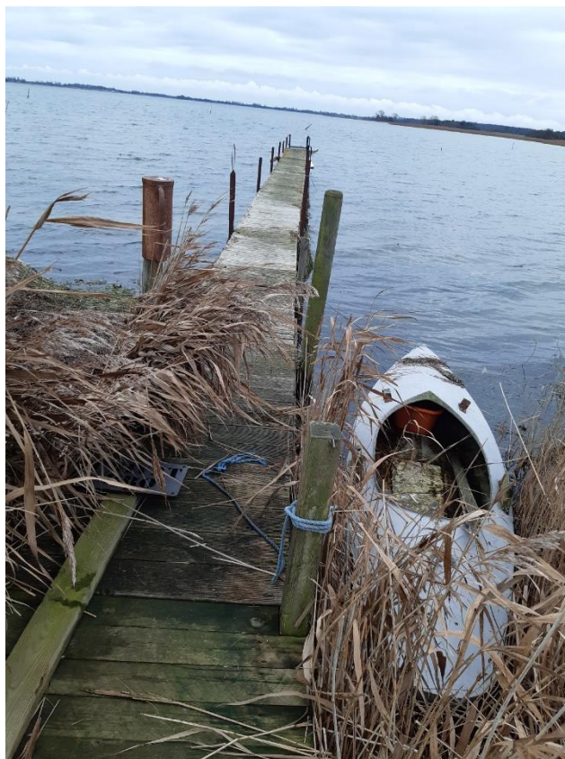
Bådebroen – foto fra 14. december 2023