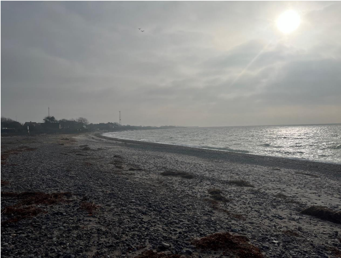
Området, kig mod sydøst og Gedser Odde