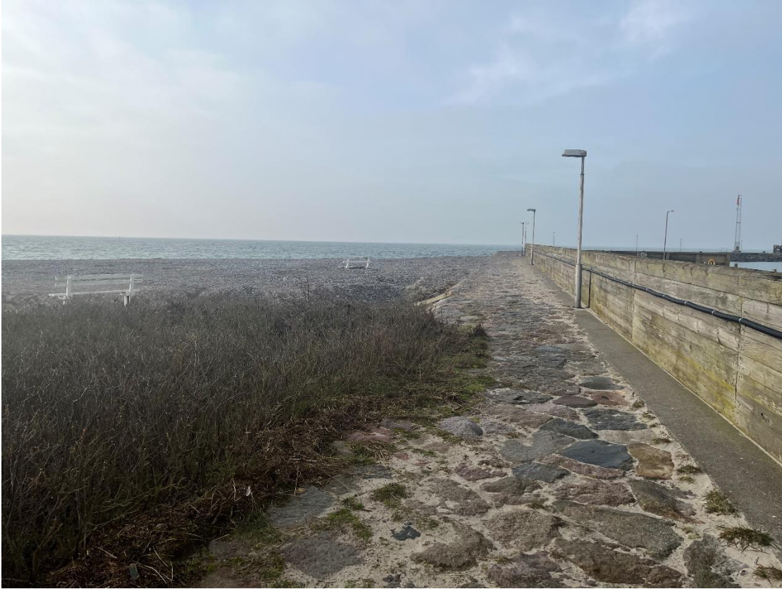
Trekant-området, kig mod sydvest