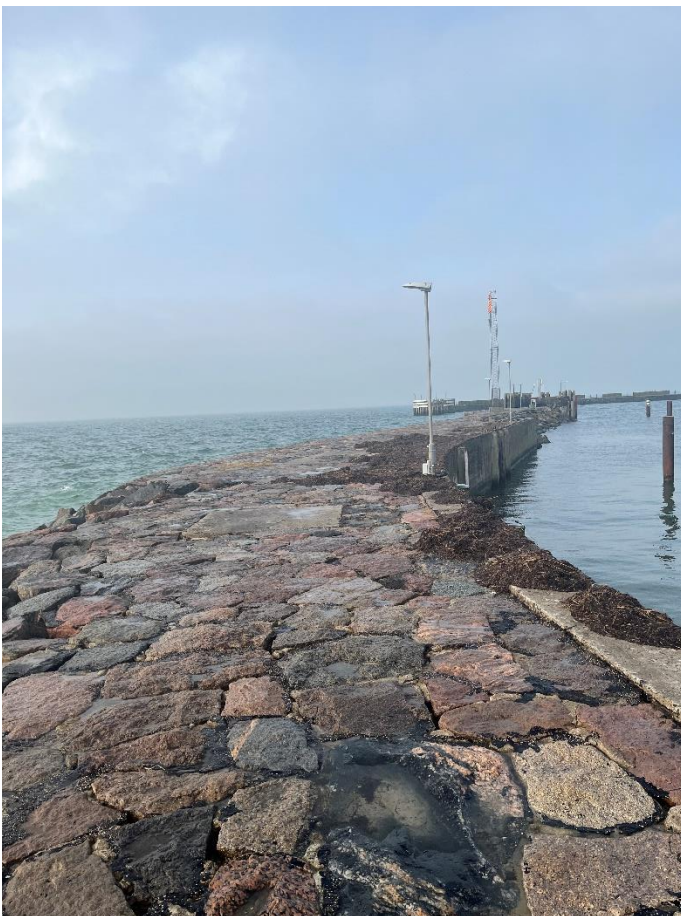
Området, kig mod vest, molen