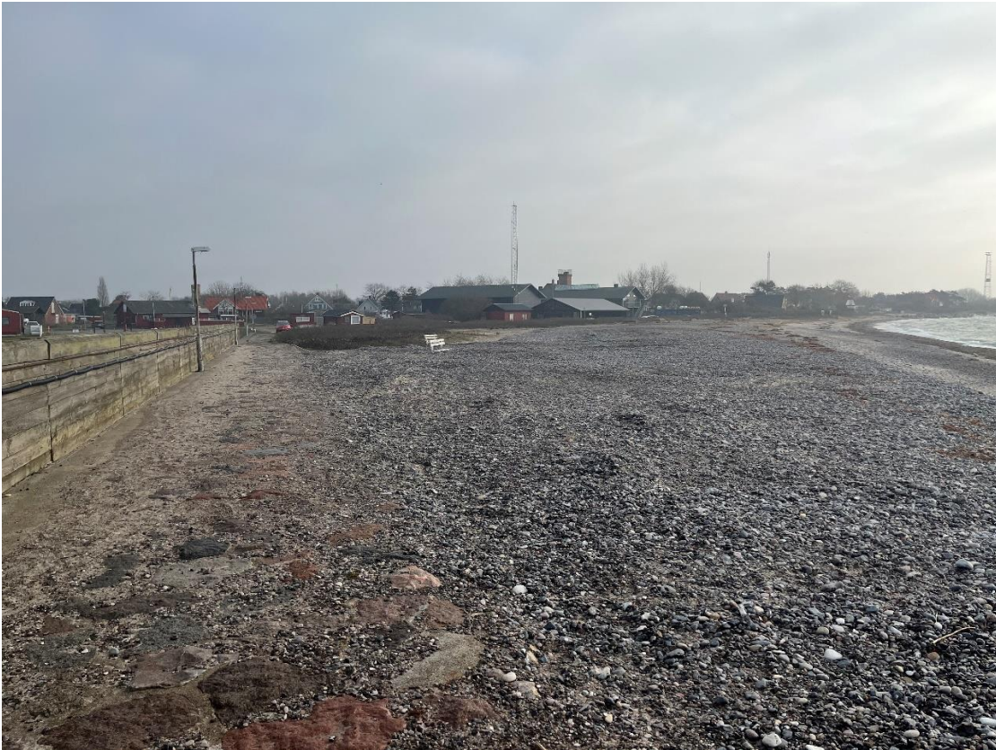
Området, kig mod øst