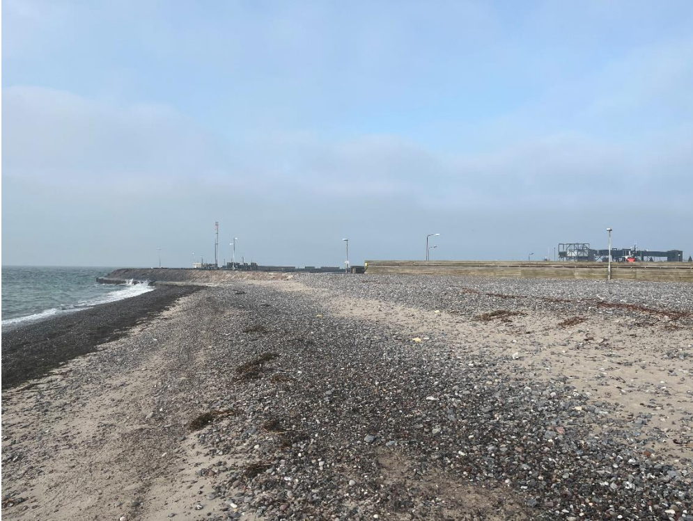
Området, kig mod vest, færgeterminalen