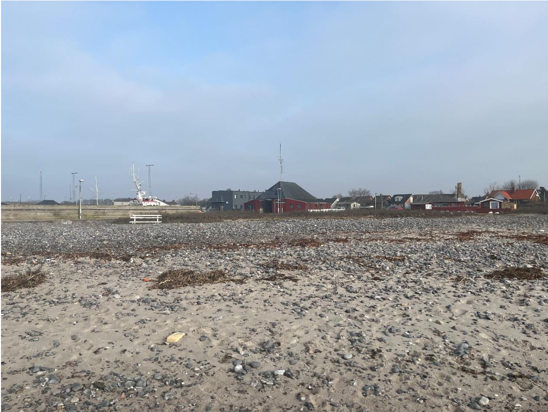
Området, kig mod nord