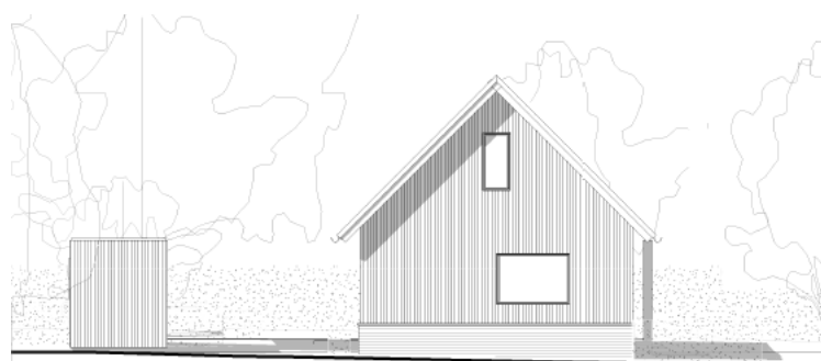
Tegningerne viser den ansøgte bygning