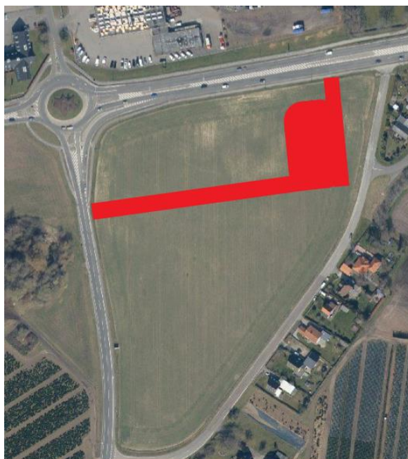
Det røde viser placeringen af det ansøgte

TELEFONTIDER: MAN-ONS KL. 9:00-11:00 TORS KL. 15:00-17:00 FRE KL. 9:00-11:00