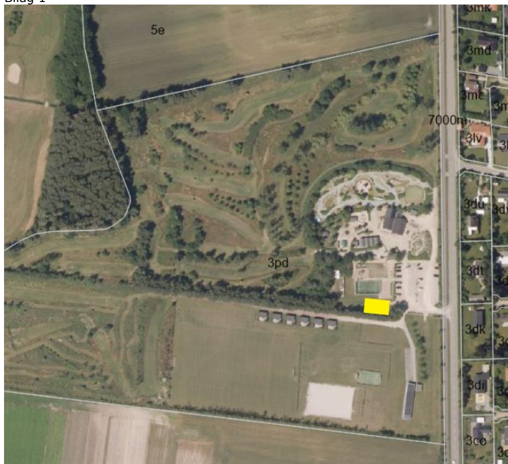
Placeringen af det ansøgte er markeret med gult.