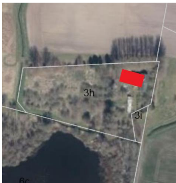
Placeringen af det ansøgte er markeret med rødt

TELEFONTIDER: MAN-ONS KL. 9:00-11:00 TORS KL. 15:00-17:00 FRE KL. 9:00-11:00