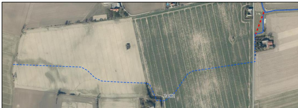
Billede 2; Oversigtskort over hele vandløbsstrækningen. Rørlægningen vises med stiplede rød linje