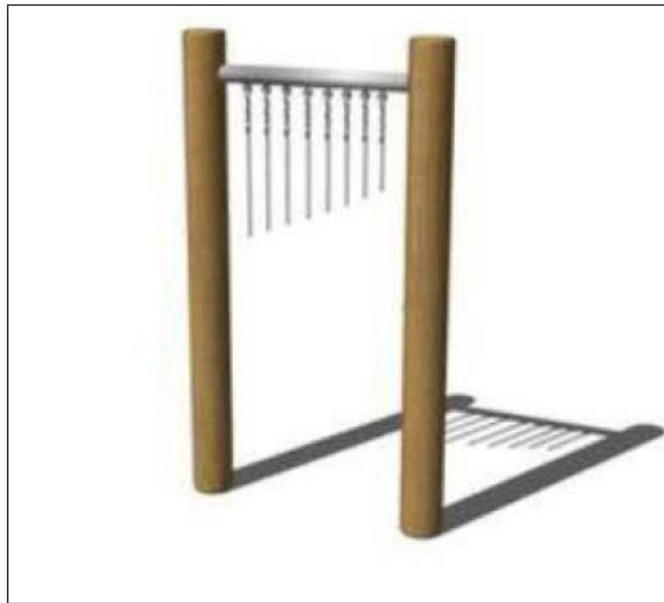
Billedet viser eksempel på musikinstrument

Insekthotel, fuglehuse, spejle, musikinstrumenter