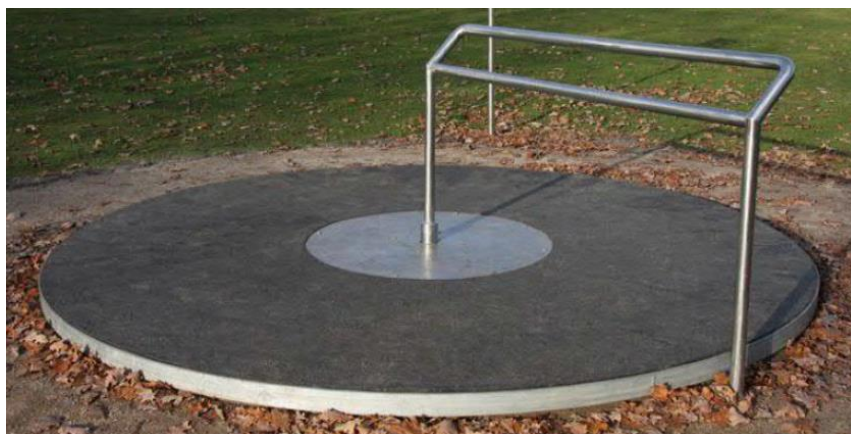
Billederne viser eksempler på fitnessredskaber