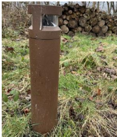
Billedet af typen af lyspullert

Der vil være 15 lyspullerter, placeret langs stien gennem skovområdet.