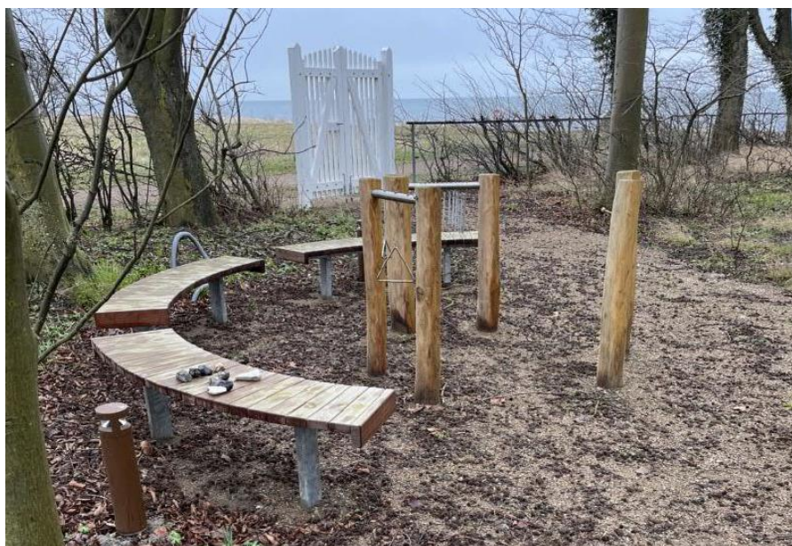
Billederne viser en af bænken, samt lyspullert og musikinstrumenter.