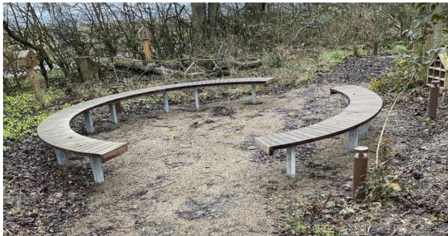
Billederne viser bænken som placeres i området