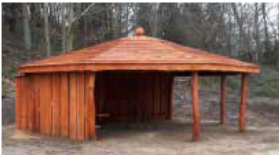
Billedet viser hvordan bålhytten vil se ud.

Bålhytten vil have en størrelse på 8 m i diameter og en højde på 3,7 m)