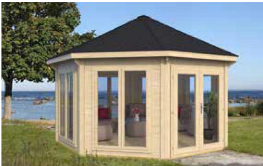
Billedet viser hvordan terapihytten vil se ud.

Bygningen vil være 8-kantet og have en størrelse på ca. 30 m 2 . Den monteres med vinduer hele vejen rundt.