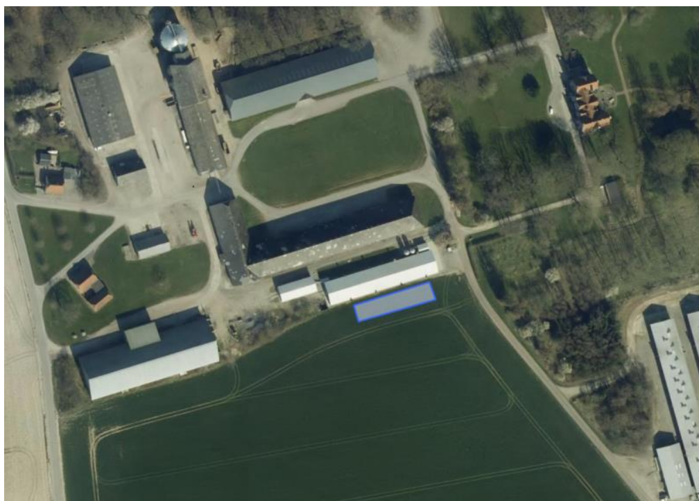
Billedet viser placeringen af solcellerne