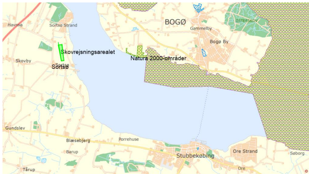
Oversigtskort – Nordfalster – Skovrejsningsarealet ved Sortsø er angivet med lysegrøn signatur. Natura 2000-områder er angivet med skraveret signatur.