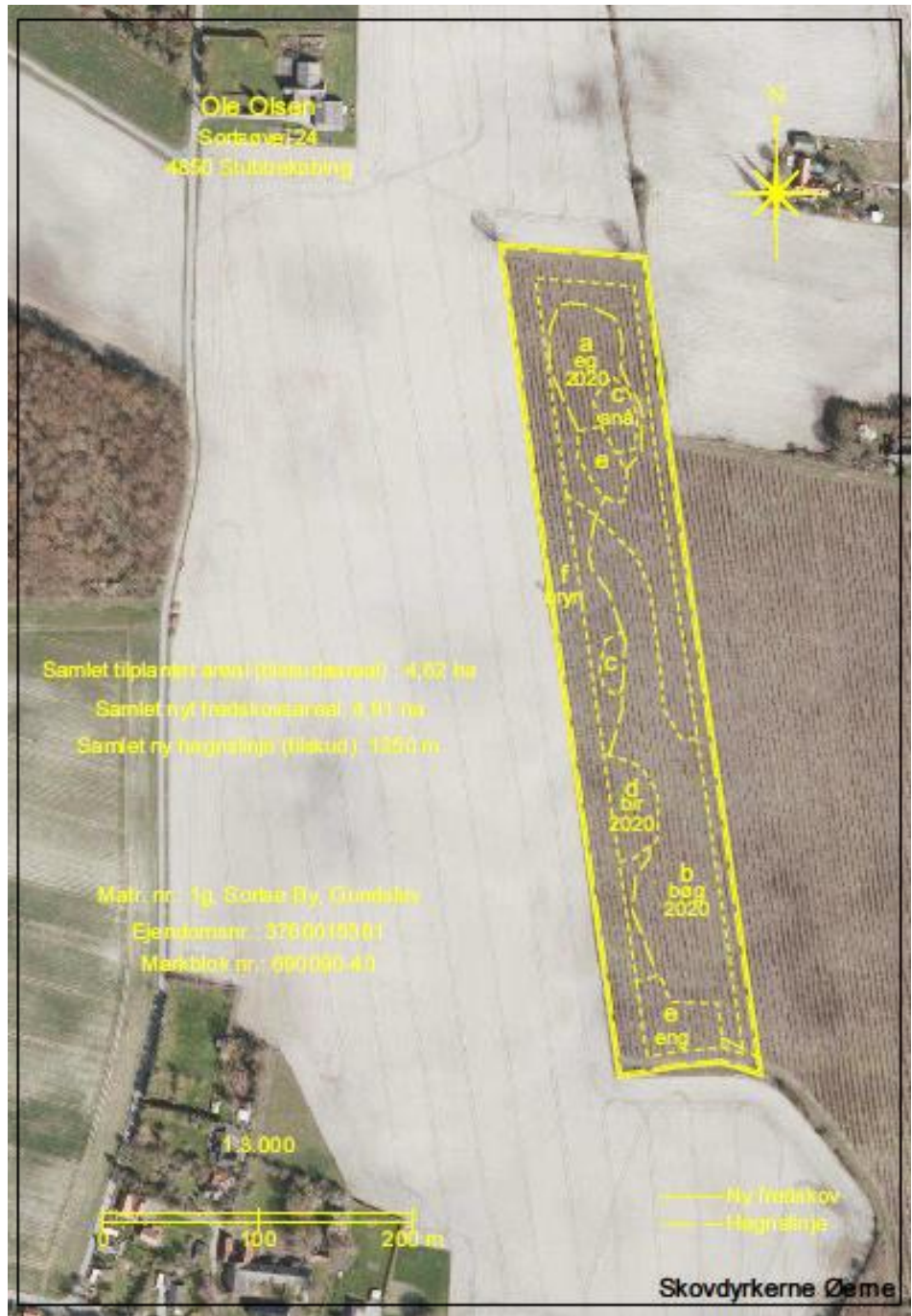
Skovkort udarbejdet af Skovdykerne.